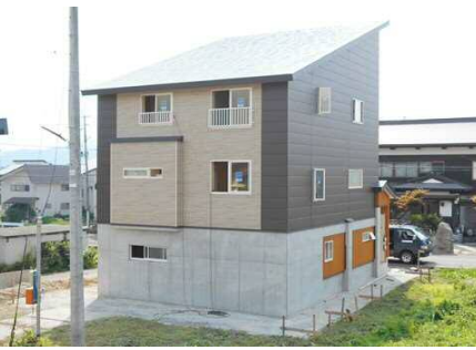
「K・T」様邸 魚沼市井口新田地内