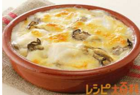
カキとタラの簡単グラタン