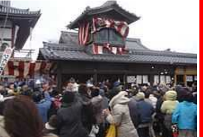
神社での「豆まき」風景