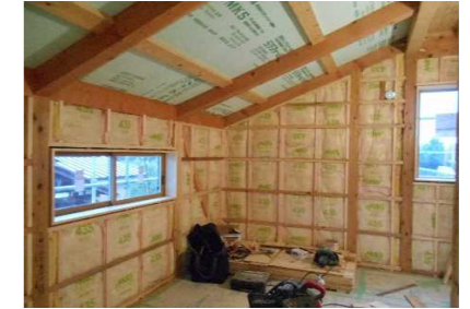
3階子供室の屋根なり斜め天井の断熱状況

御存じのように弊社は 構造計算、確認申請を外注任せにせず自前で行っています 長期優良住宅の省エネ計算、技術的審査申請、認定申請も、もちろん自前ですの 外注業者に費用を払う必要はありません(申請手数料はかかります) 税金の軽減、旧住宅金融公庫の最低金利の適用など お客様にとっていいこと尽くしです。